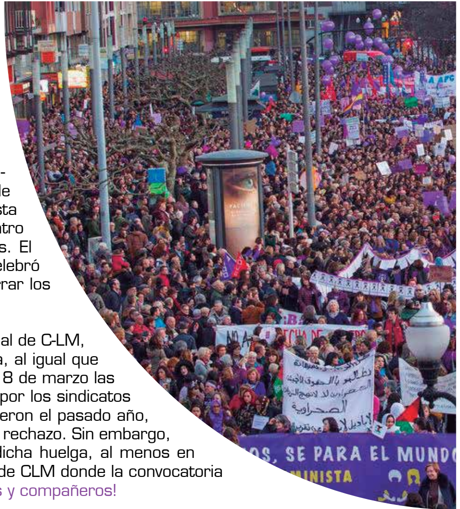
Gijón 8M 2018

La Confederación Intersindical, a la que pertenece Intersindical de C-LM, asumiendo dicho mandato, va a llevar a cabo la convocatoria, al igual que los sindicatos CGT y CNT, con el convencimiento de que este 8 de marzo las mujeres volveremos a hacer historia. La decisión anunciada por los sindicatos CC.OO y UGT de convocar paros de dos horas, como ya hicieron el pasado año, ha sido recibida por el movimiento feminista con indignación y rechazo. Sin embargo, parecen asumir paulatinamente la necesidad de convocar dicha huelga, al menos en ciertos ámbitos sectoriales y territoriales, como en la Junta de CLM donde la convocatoria será inequívocamente de 24 horas. ¡A la huelga compañeras y compañeros!